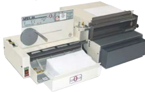
HD 7000 mit APES 14-77

Jede HD 7000 oder HD 7700 Ultima ist nachträglich zur Autopunchstation ausbaubar. Dies bietet Ihnen optimale Investitionssicherheit